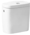
Cisterna de doble descarga 6/3L con alimentación inferior para inodoro